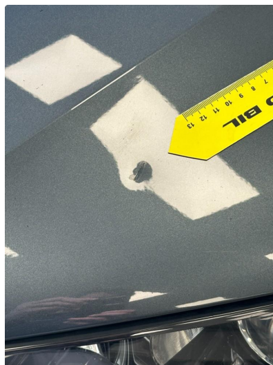
1.1 Liten bulk med lakkskade i panser venstre side