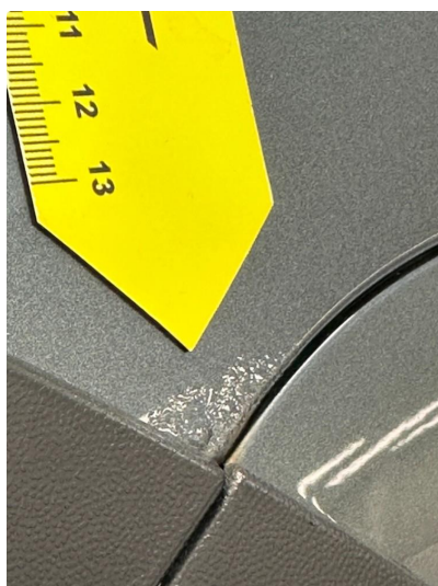
1.3 Små "bobler" i lakken på skjerm venstre bak