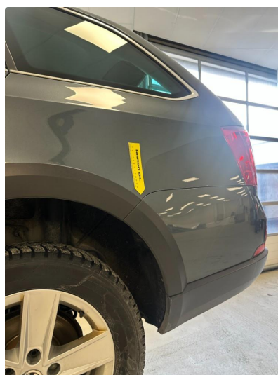
1.3 Små "bobler" i lakken på skjerm venstre bak