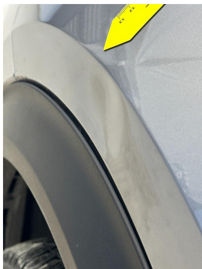
1.1 Bulk i skjerm venstre foran