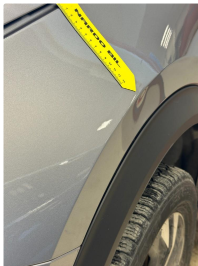
1.1 Bulk i skjerm venstre foran