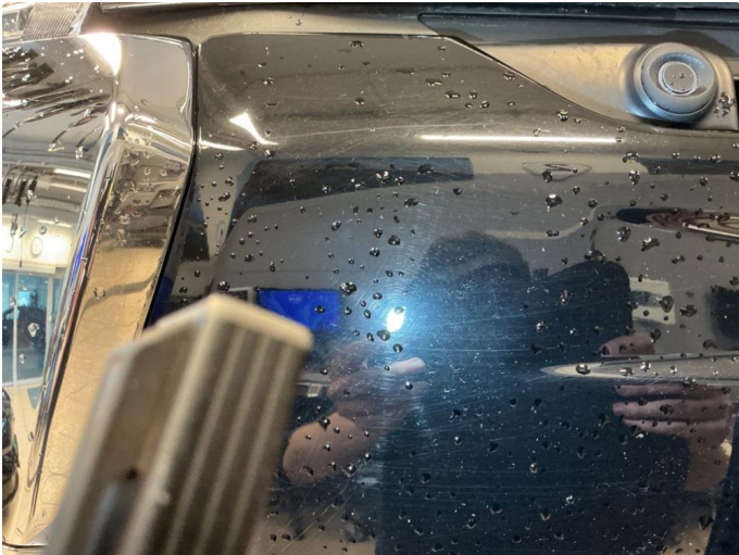
1.1 Noen riper på støtfanger