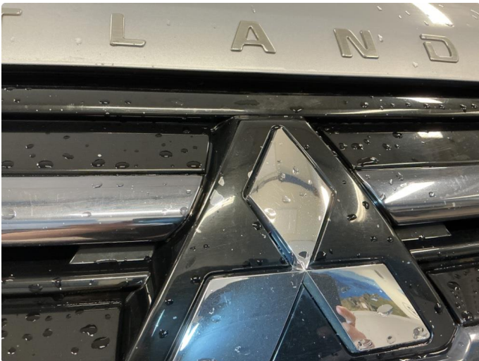
1.2 Noe lakklass på grill