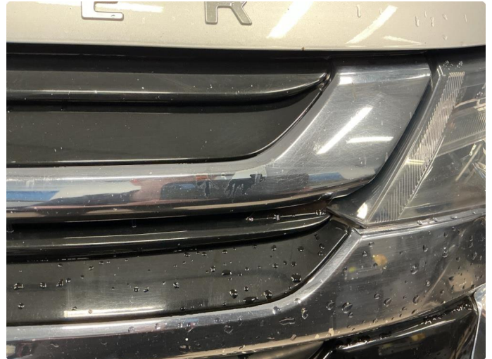
1.2 Noe lakklass på grill