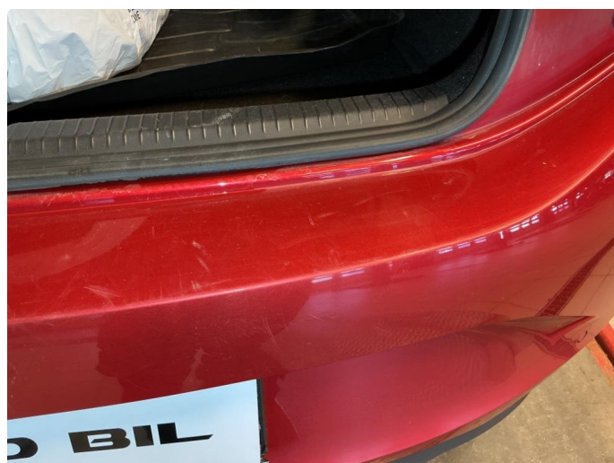
1.2 Bruksriper på bakskjerm