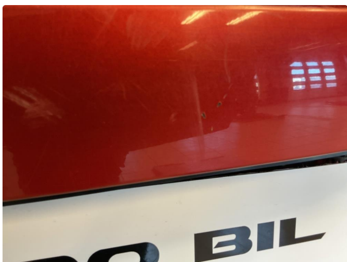
1.2 Bruksriper på bakskjerm