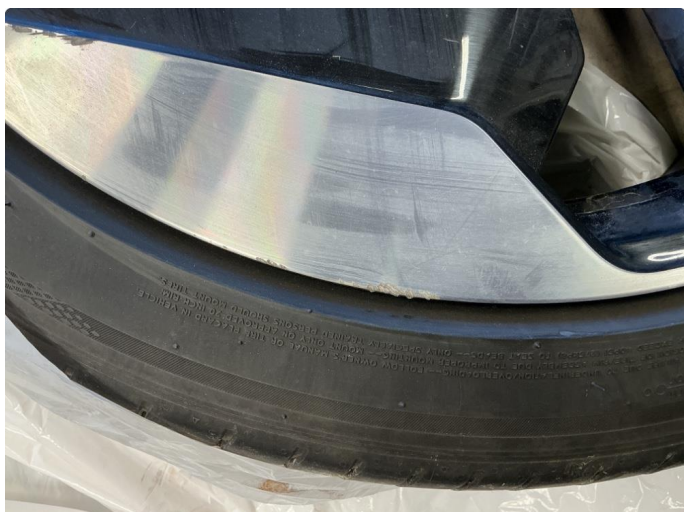
1.1 Liten kantkjøring på felg