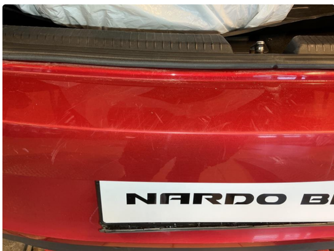
1.2 Bruksriper på bakskjerm