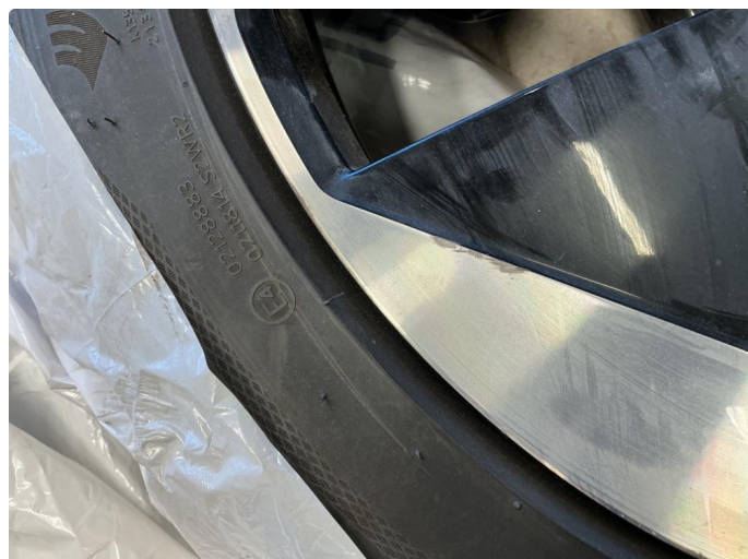
1.1 Liten kantkjøring på felg