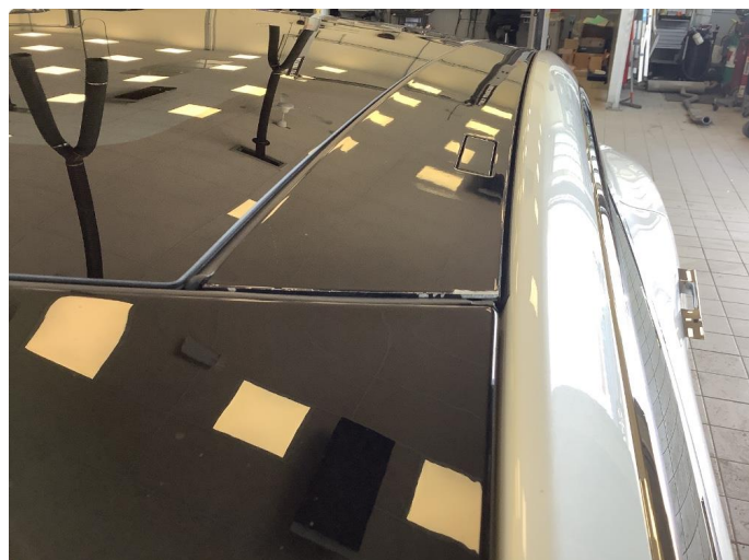
1.2 Noe lakkmerker