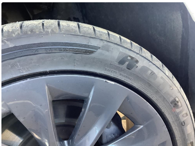
1.1 Små bruksmerker