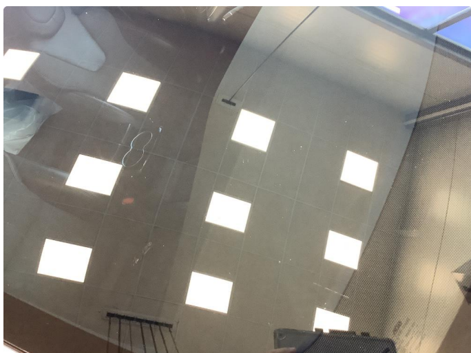
1.3 Noe brukslitasje