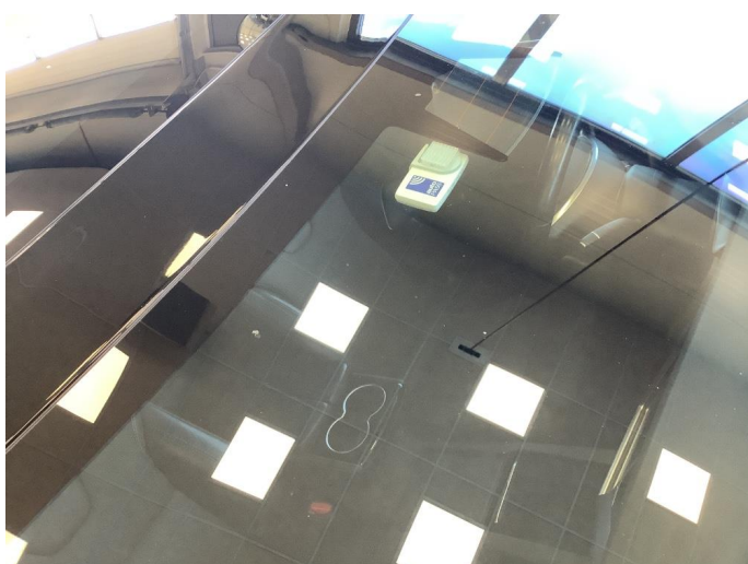
1.3 Noe brukslitasje