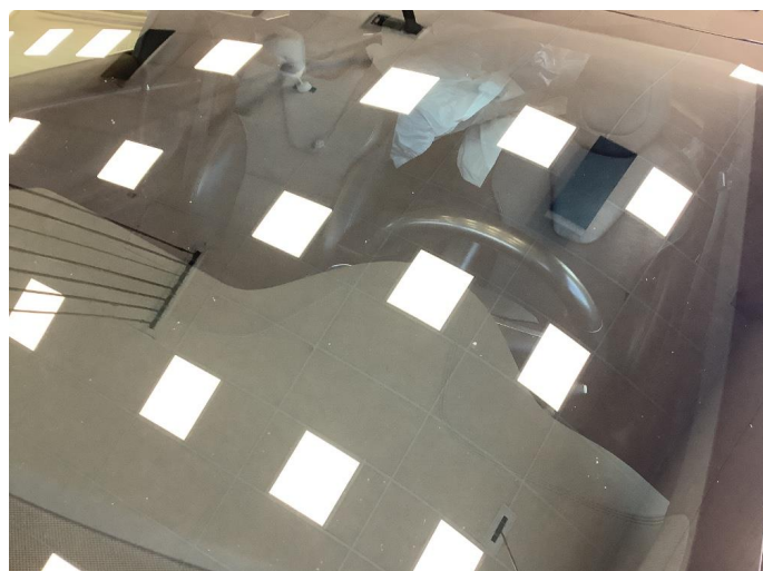
1.3 Noe brukslitasje