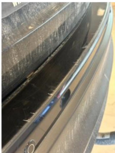
1.2 Noen små riper på innlastningszone