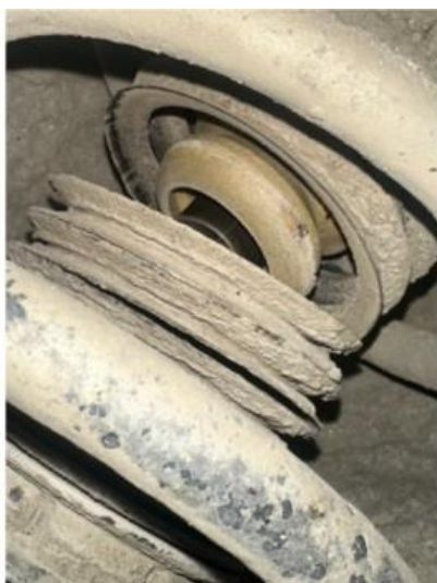
2.1 Begge støvmansjetter foran defekte