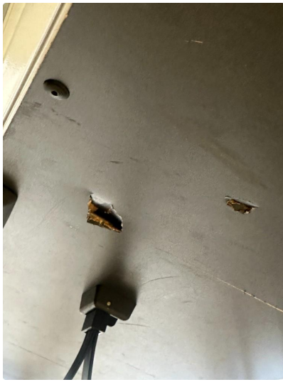
2.1 Noen små skader i bakluketrek