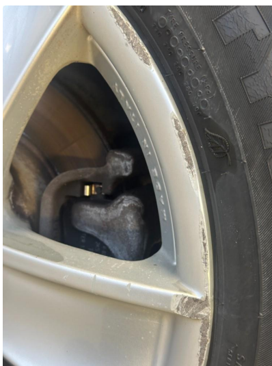
1.2 Vinterfelger litt kantkjørt