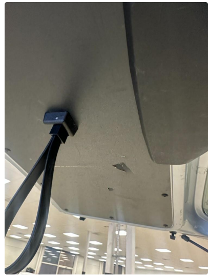
2.1 Noen små skader i bakluketrek