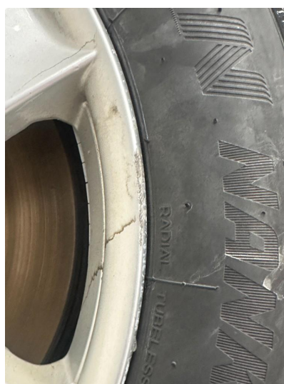
1.2 Vinterfelger litt kantkjørt