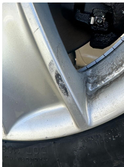
1.2 Vinterfelger litt kantkjørt