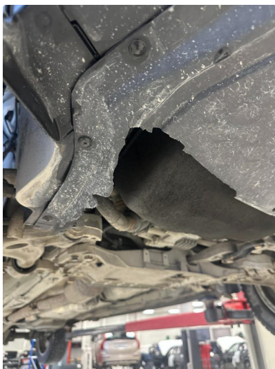
1.1 Noen sprekker i beskyttelsesplate under bilen