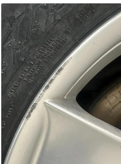
1.2 Vinterfelger litt kantkjørt