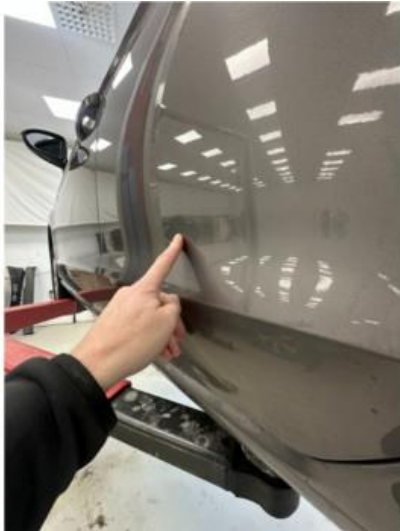
1.1 Liten p.bulk i dør venstre bak