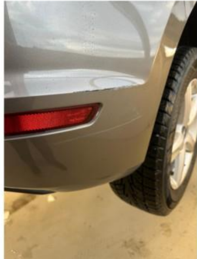
1.2 Noen riper i fanger høyre bak