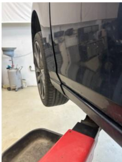
1.2 Liten skade i skjerm venstre foran