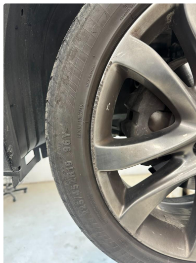
1.3 2 stk sommerfelger kantskjørt