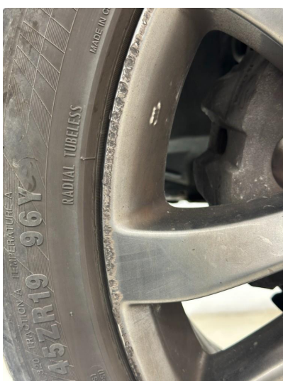
1.3 2 stk sommerfelger kantskjørt