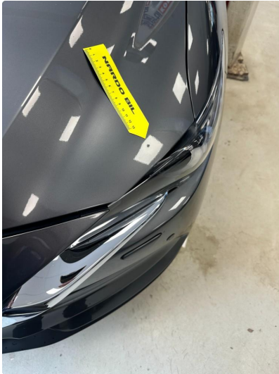
1.1 Liten bulk med lakkskade i panser venstre foran