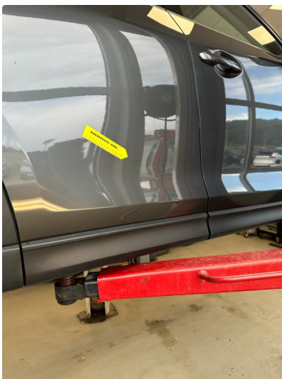
1.2 Litt lakksig i dør høyre bak