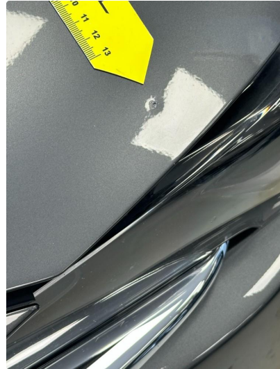
1.1 Liten bulk med lakkskade i panser venstre foran