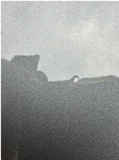
1.2 Litt lakksig i dør høyre bak