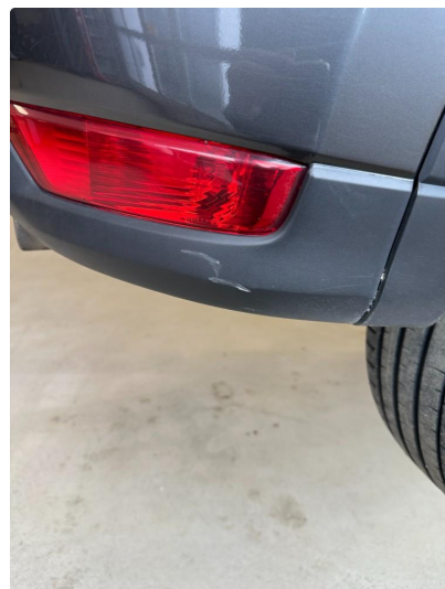
1.3 Riper i fanger bak