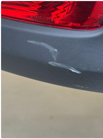
1.3 Riper i fanger bak