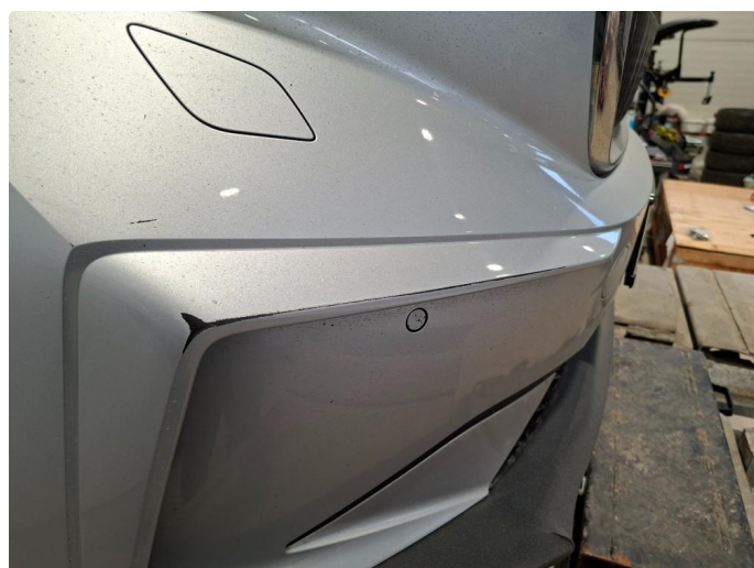
1.3 Lister skadet/mangler