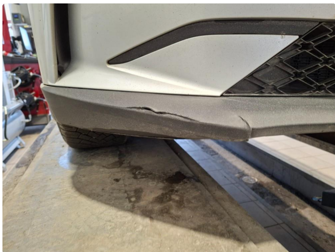
1.3 Lister skadet/mangler