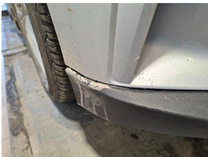
1.3 Lister skadet/mangler