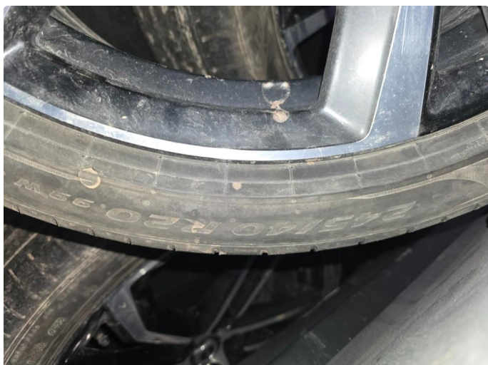
1.1 Nye sommerdekk