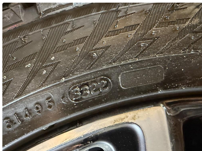
1.2 Nye vinterdekk