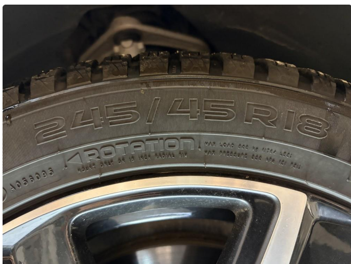
1.2 Nye vinterdekk