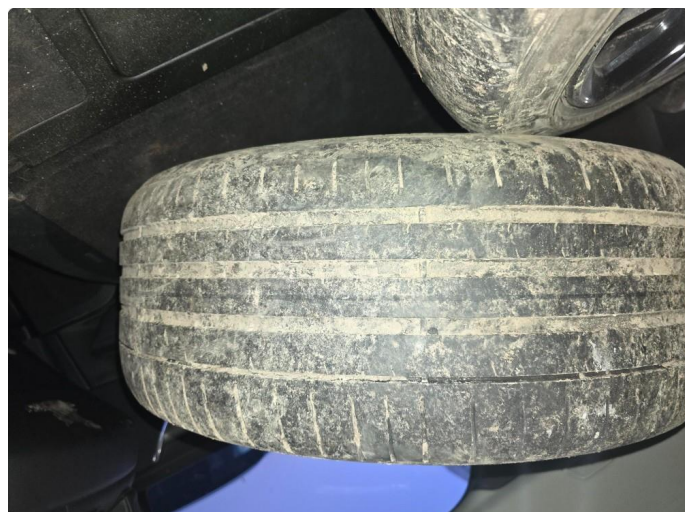
1.1 Nye sommerdekk