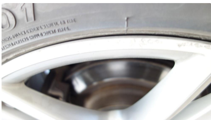
1.4 Kantkjørt felg Diamond Cut