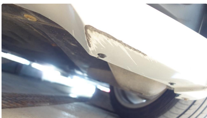
1.6 Ripe oppunder frontfanger