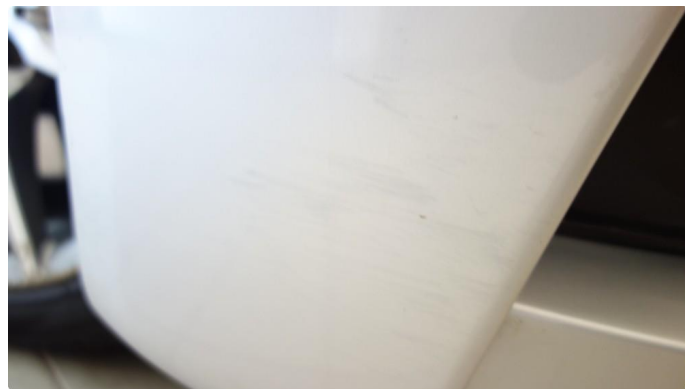
1.6 Ripe oppunder frontfanger