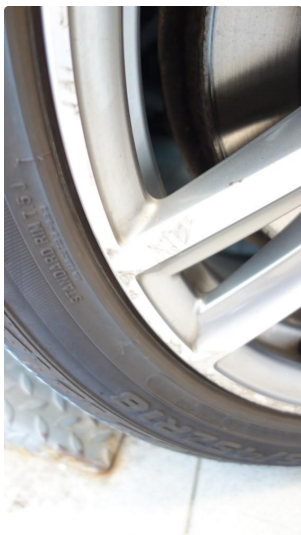
1.4 Kantkjørt felg Diamond Cut