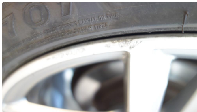
1.4 Kantkjørt felg Diamond Cut