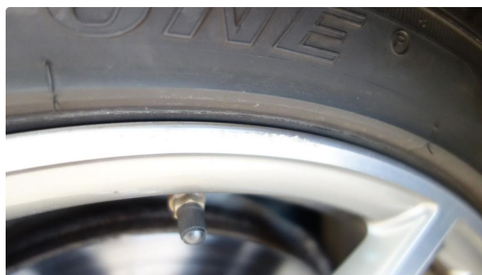
1.4 Kantkjørt felg Diamond Cut