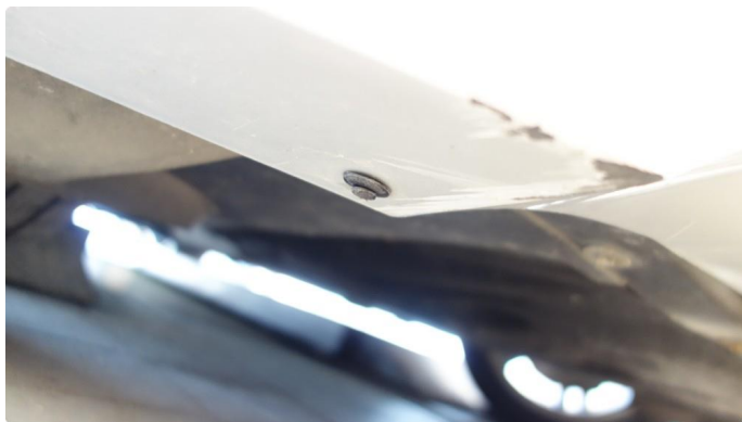
1.6 Ripe oppunder frontfanger