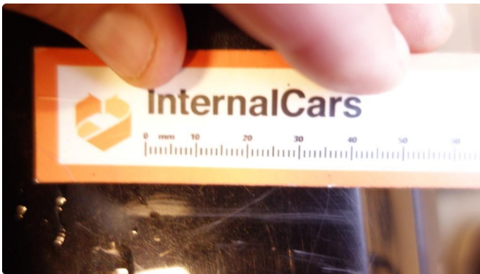
1.1 Riper poleres