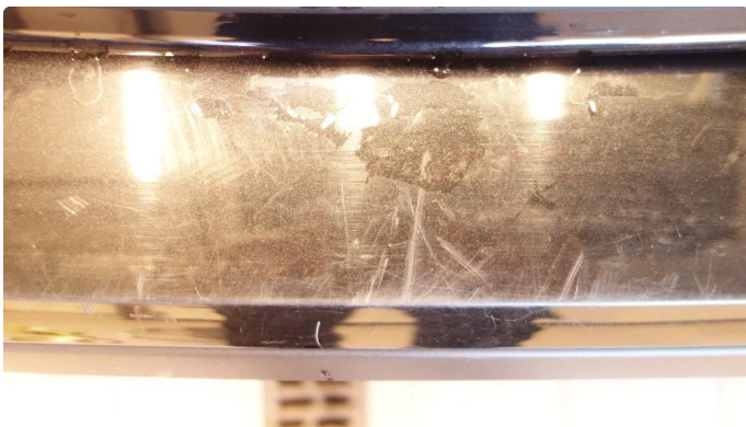
1.1 Riper poleres