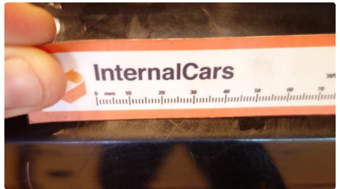
1.1 Riper poleres