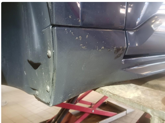
1.1 Noe matt lakk bak hjulbuer