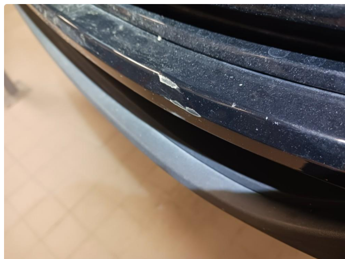
1.2 Merke i støtfanger foran.