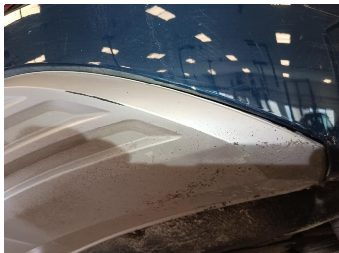
1.2 Ripe i lakk