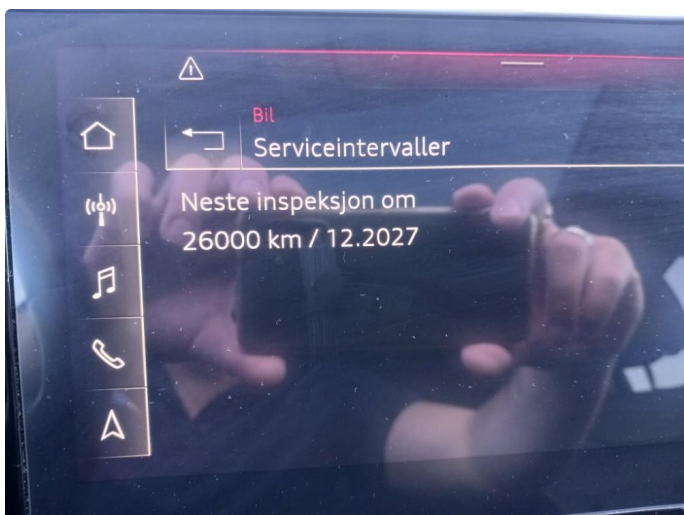
2.1 Dokumentert service, se bilde