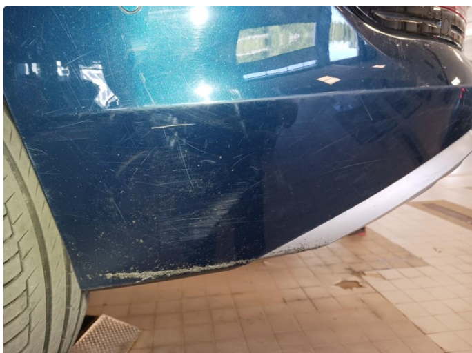
1.1 Ripe i lakk