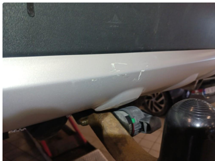
1.3 Ripe i støtfanger