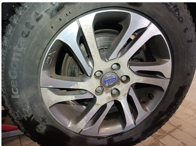
1.1 Oksidering felg