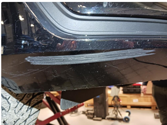
1.2 Ripe til grunning - Utenfor synsfelt.