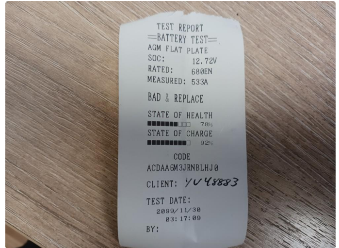
2.1 Gammelt startbatteri - blir skiftet.