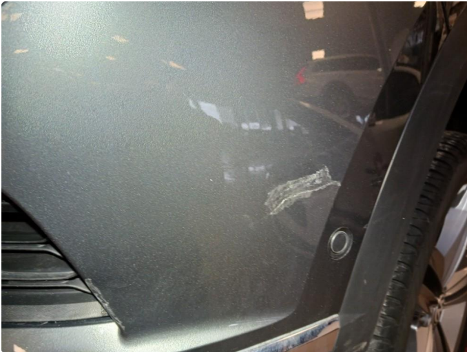
1.1 Merke i støtfanger bak.