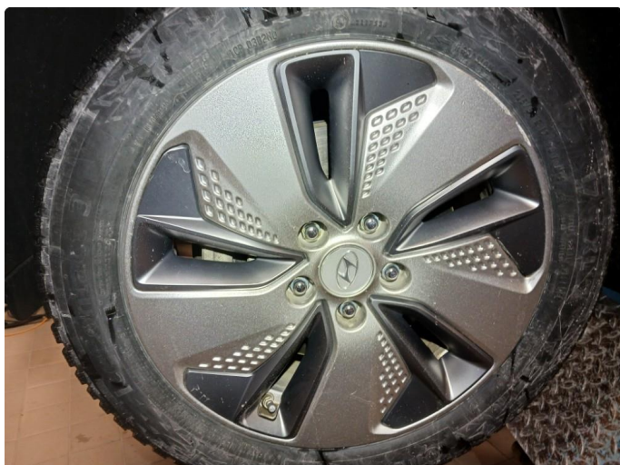
1.1 Merke i felg