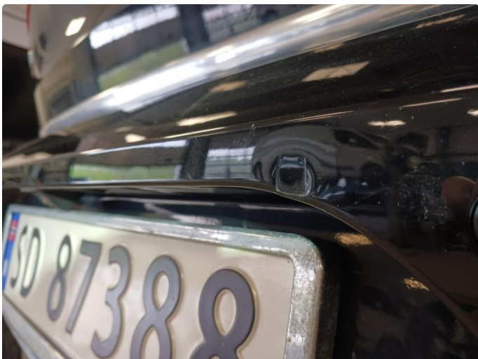
1.3 Merke i støtfanger bak