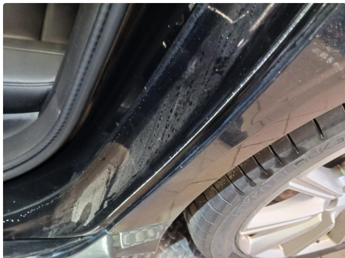
1.2 Lakkslitasje døråpning.