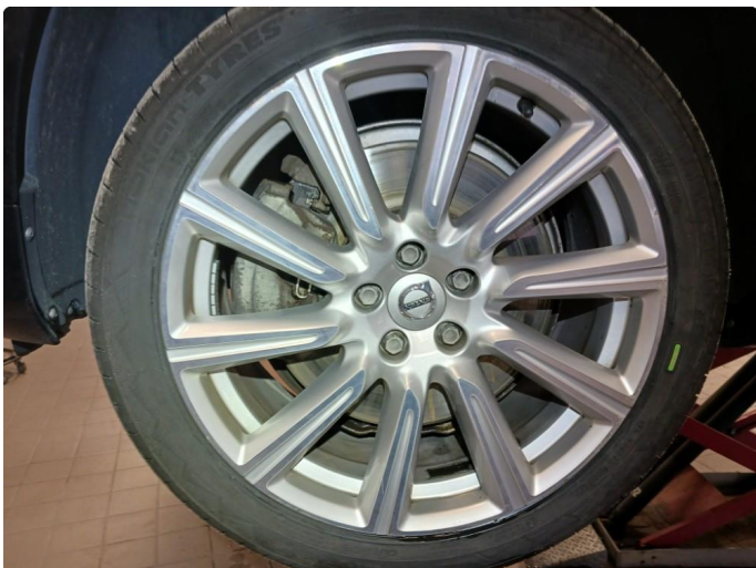
1.1 Merke i felg